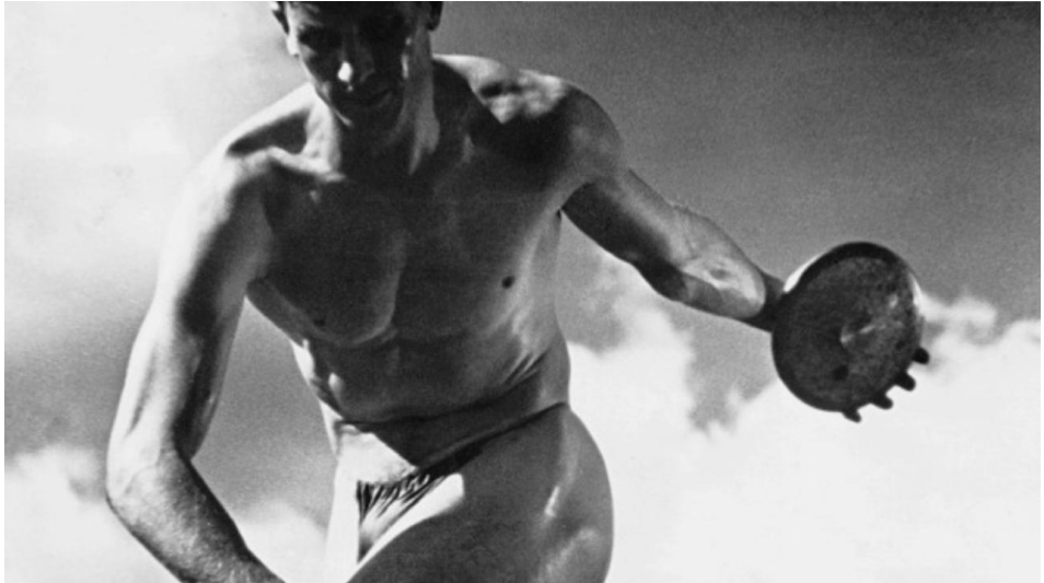
Leni Riefenstahl: Olympia (1939)

Op 10 maart ontmoeten we elkaar in de huiskamer van familie Hiemstra, aan de Schelfhorst 8. Wat kun je verwachten? Lees hieronder iets over de huiskamerbijeenkomst op 17 februari.