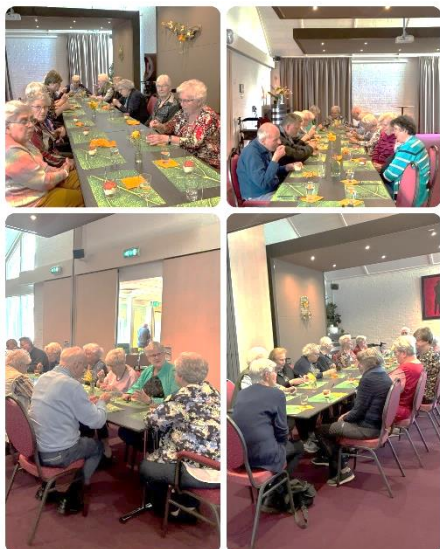
Groeten en Ontmoeten april

Alzheimercafé Zuidlaren De Enk, iedere 3 e donderdag van de maand